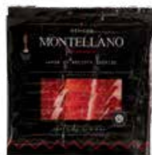
50 gr Jambon Ibérique Bellota Tranché