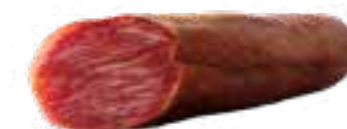
+/- 1 kg Lomo Ibérique Cebo