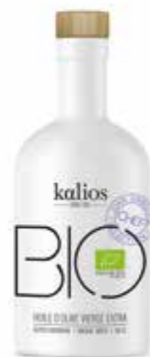
500 ml Bouteille huile d'olive Bio - Récolte début de saison 3 770003 906117

Nos huiles d'olives ont remporté la Médaille d'Or au concours des Épiciers de l'épicerie fine.