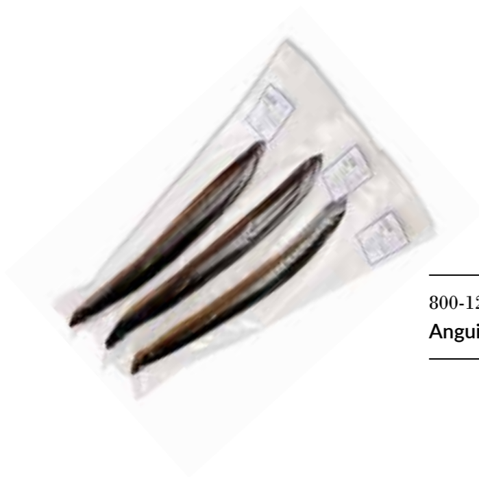
800-1200 gr Anguille fumée entière