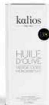
5 L Bidon huile d'olive Bio - Récolte début de saison KG-BIO

Récolte de décembre, équilibre entre fruité vert et mûr, notes florales, d'artichaut, de noisette, d'amandes. Idéale pour vos pâtes fraîches, poissons grillés et marinades.