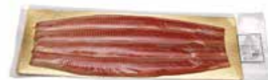
600-800 gr Filets d'anguille fumée