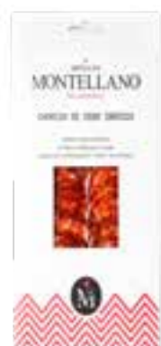
100 gr Chorizo Ibérique Cebo Tranché