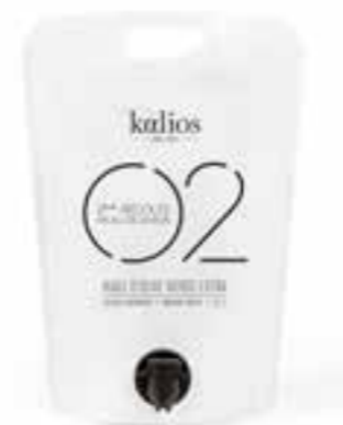
2,5 l Bidon huile d'olive O2 - Récolte mi-saison 3 760 301 421 689

Récolte de novembre, fruité vert équilibré, notes végétales et poivrées. Idéale pour vos salades de tomates, carpaccios et fromages crémeux.