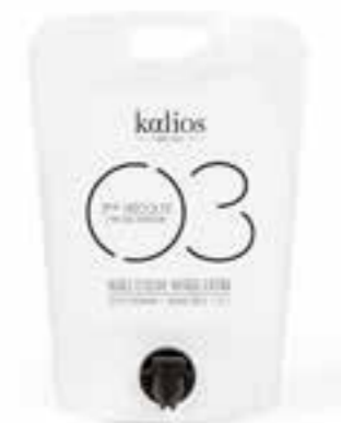
2,5 l Bidon huile d'olive O3 - Récolte fin saison 3 760 301 421 696

Récolte de décembre, équilibre entre fruité vert et mûr, notes florales, d'artichaut, de noisette, d'amandes. Idéale pour vos pâtes fraîches, poissons grillés et marinades.