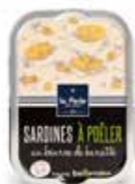
Sardines à poêler au beurre de baratte