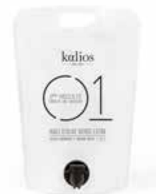
2,5 l Bidon huile d'olive O1 - Récolte début de saison 3 760 301 421 672

Récolte de novembre, fruité vert équilibré, notes végétales et poivrées. Idéale pour vos salades de tomates, carpaccios et fromages crémeux.