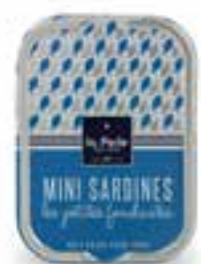
115 gr Mini sardines «Les petites fondantes»

Pêchées à Saint-Gilles-Croix-de-Vie en pleine saison et emboîtées dans les heures suivant la pêche, découvrez nos conserves de sardines au goût unique. Naturellement riches en oméga, le petit poisson bleu est un véritable allié pour votre santé !