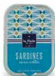
115 gr Sardines sans arêtes