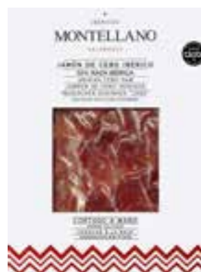
100 gr Jambon Ibérique Cebo Tranché