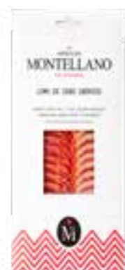
100 gr Lomo Ibérique Cebo Tranché