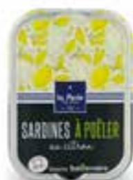
115 gr Sardines à poêler au citron