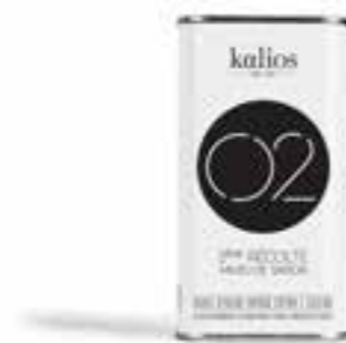
250 ml Bidon huile d'olive O2 - Récolte mi-saison 3 770003 906063

Récolte de novembre, fruité vert équilibré, notes végétales et poivrées. Idéale pour vos salades de tomates, carpaccios et fromages crémeux.