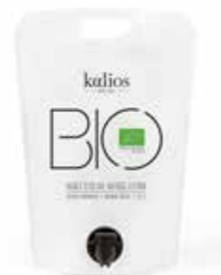
2,5 l Bidon huile d'olive Bio Récolte début de saison 3 760 301 421 702

Récolte de décembre, équilibre entre fruité vert et mûr, notes florales, d'artichaut, de noisette, d'amande. Idéale pour vos pâtes fraîches, poissons grillés et marinades.