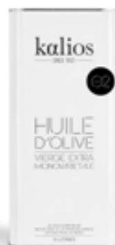
5 L Bidon huile d'olive O2 - Récolte mi-saison KG-02

Récolte de novembre, fruité vert, notes d'herbes coupées et noisette fraîche. Idéale pour vos salades, légumes vapeur et crudités.