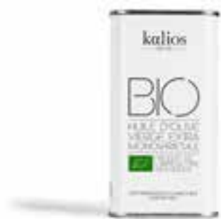
250 ml Bidon huile d'olive Bio Récolte début de saison 3 770003 906070

Récolte de novembre, fruité vert équilibré, notes végétales et poivrées. Idéale pour vos salades de tomates, carpaccios et fromages crémeux.