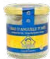
120 gr Gras d'anguille fumée 5 200114 200142