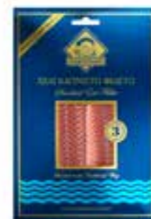
100 gr Filets d'anguille fumée Fumaison à froid 3 770003 906155