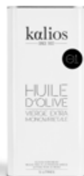
5 L Bidon huile d'olive O1 - Récolte début de saison KG-01

Récolte de novembre, fruité vert, notes d'herbes coupées et noisette fraîche. Idéale pour vos salades, légumes vapeur et crudités.